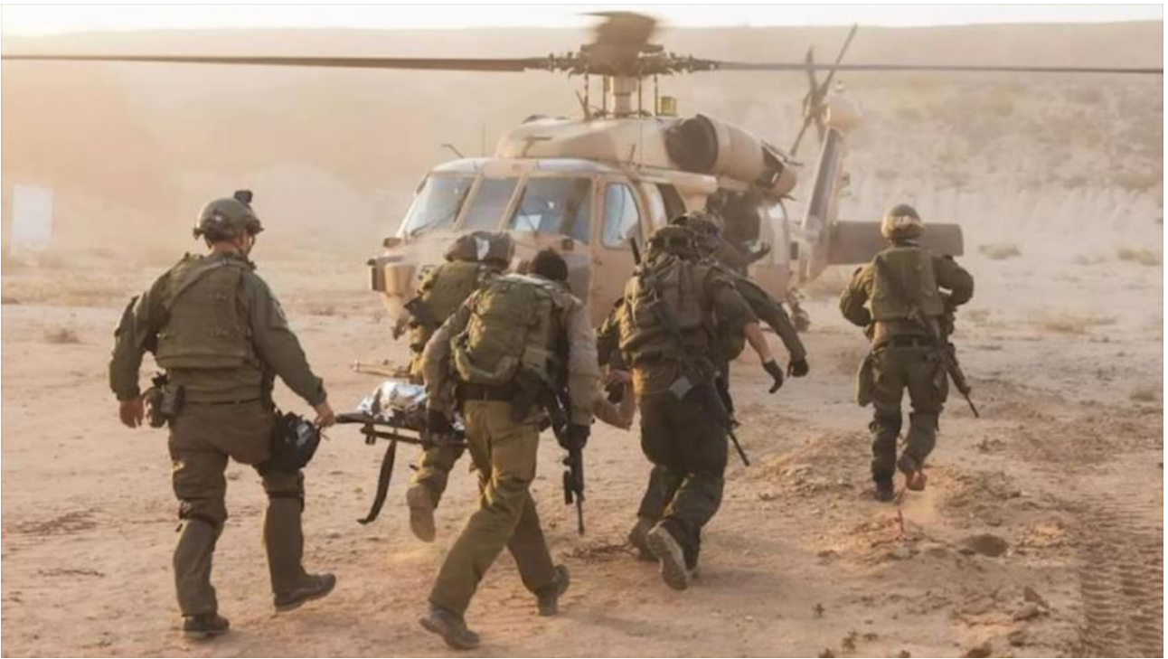
Soldati israeliani feriti ed evacuati

Secondo lui, sulla riva destra del Dnepr, in Ucraina, è in corso un “genocidio di russi” , con il “regime nazista di Kiev” che sta liberando la zona per i rifugiati israeliani uccidendo e deportando uomini provenienti da Dnipropetrovsk, Mykolaiv, Kherson e Odessa.