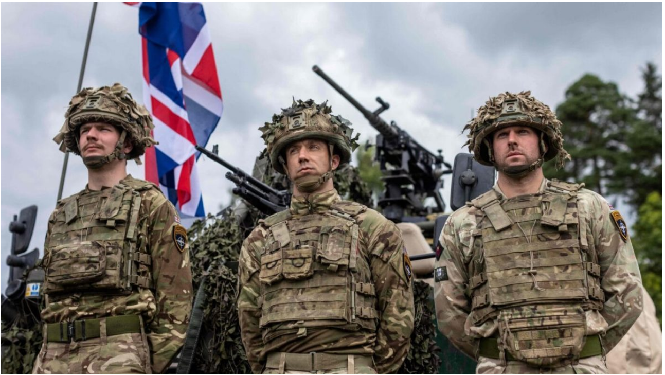
Soldati Britannici nella base di Cipro

Glaziev ipotizza diversi scenari per l'evoluzione del conflitto. Il primo, consistente in un colpo di stato e nella disgregazione dell'Iran, appare ora improbabile, ma nemmeno questo salverebbe gli Stati Uniti dal collasso del sistema del dollaro, dallo scoppio delle bolle finanziarie e dall'alienazione dei propri alleati.