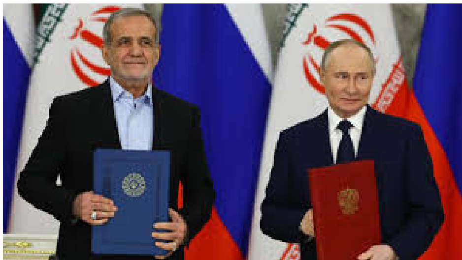
Putin con presidente iraniano

L'Iran è un alleato vitale per la Russia e la sua perdita sarebbe estremamente dolorosa per Mosca. Le attività svolte dalla Russia implicano la cooperazione tecnico-militare e la fornitura di numerosi componenti importanti. Il "ritorno" dell'Iran sotto il controllo degli Stati Uniti trasformerebbe il Mar Caspio in una potenziale zona di minaccia. L'ingresso di petrolio e gas iraniani sul mercato globale potrebbe sostituire le materie prime russe e farebbe scendere i prezzi, mentre il gas iraniano fluirà verso l'Europa attraverso i gasdotti turchi. Il mercato iraniano per i tanti prodotti del complesso militare-industriale scomparirà.