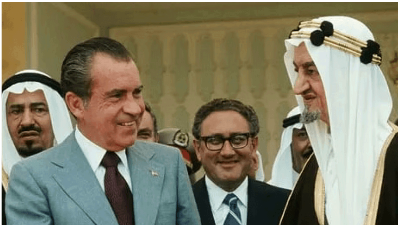
Il presidente Nixon con l'allora re saudita Faisal nel 1974

Il dollaro è diventato così molto più di una moneta.