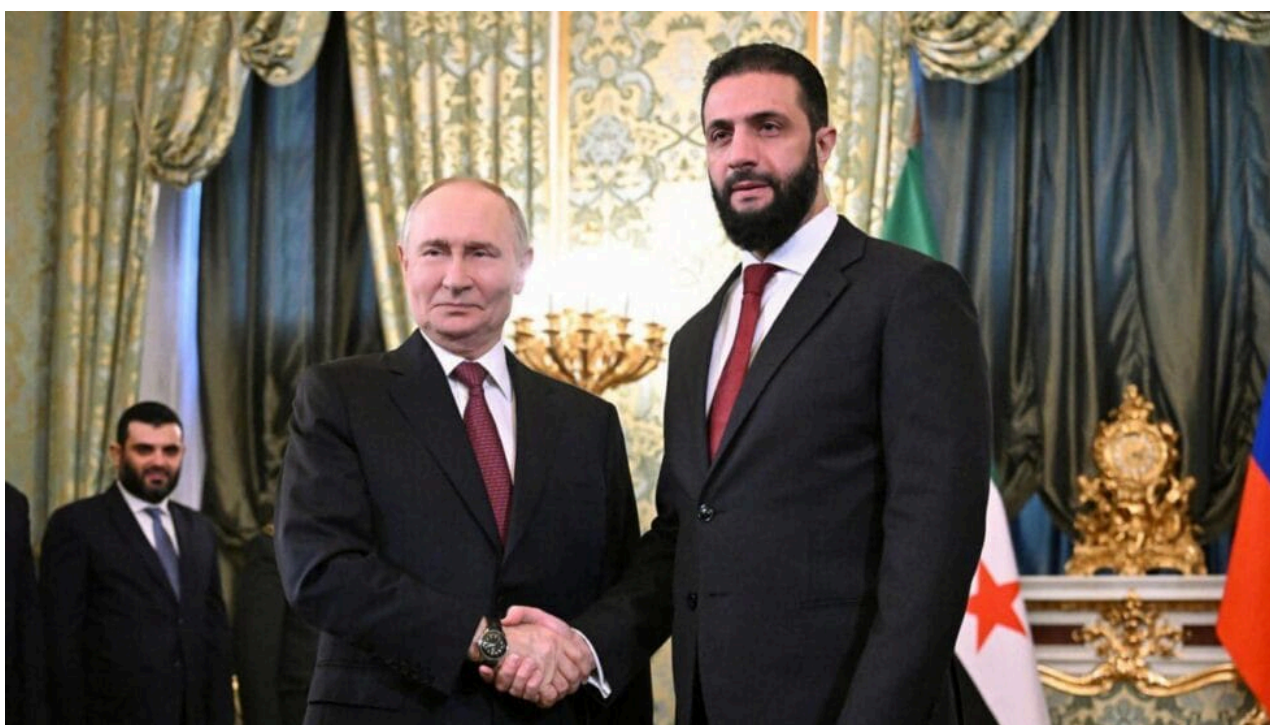
Vladimir Putin riceve al Sharaa

Un anno dopo, tali disinformatori seriali sono stati smentiti su tutta la linea perché non solo Israele è lontana dal controllare il Paese, ma i rapporti tra Damasco e Mosca si sono persino consolidati.