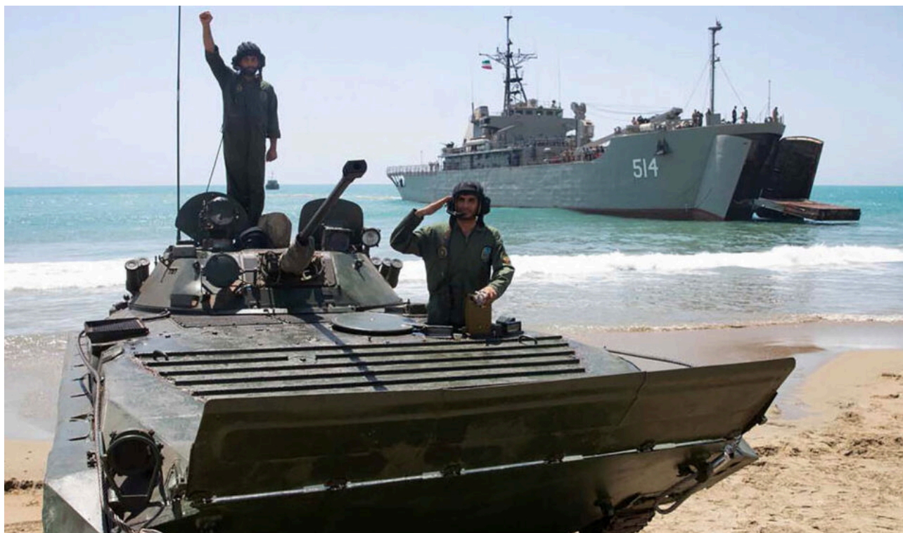
Hormuz, guardia iraniana

Ma l'Iran ha dichiarato: “Non saremo l'unico Paese a crollare”. Occhio per occhio, avverte l'Iran i suoi vicini del Golfo, indicando dove colpirà prossimamente ed elencando uno per uno i giacimenti petroliferi.