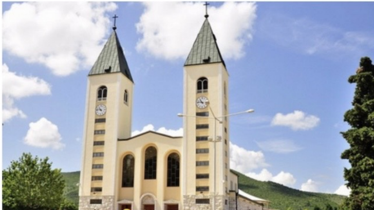
Medjugorje – Messaggio della Regina della Pace – 25 Giugno 2025 44° anniversario