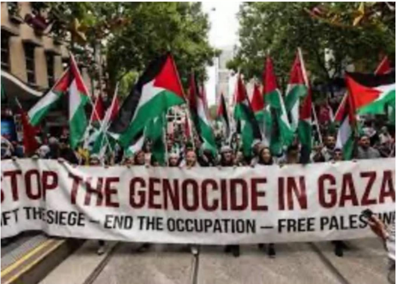
In Australia, i manifestanti esortano il governo a sostenere la causa intentata dal Sudafrica contro Israele.