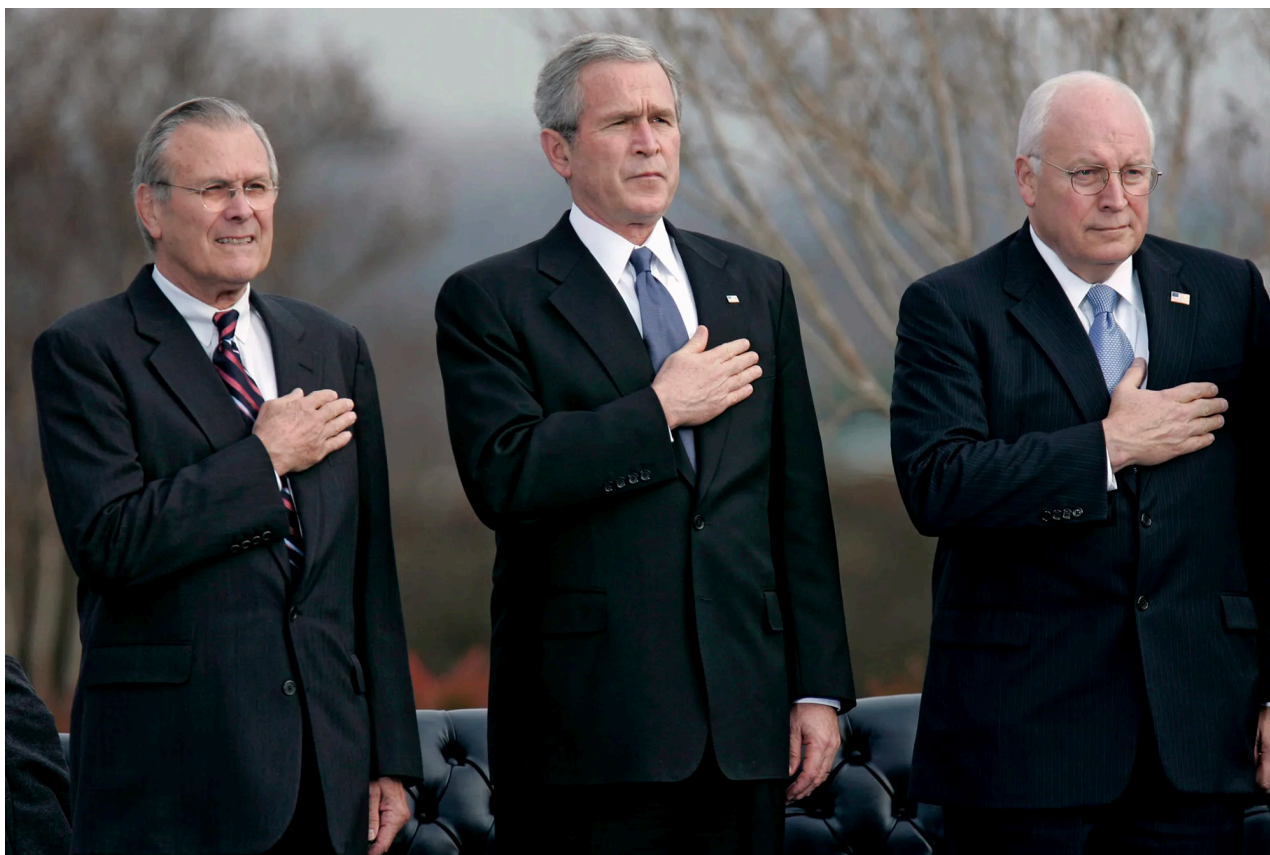
Da sinistra verso destra: Rumsfeld, Bush e Cheney, i falchi neocon

La strategia di sicurezza nazionale della Casa Bianca è del tutto antitetica a quella che i vari sionisti neocon stabilirono nel 2000 nel loro documento intitolato " Ricostruire le difese americane ", nel quale personaggi come Dick Cheney, Donald Rumsfeld, John Bolton e Paul Wolfowitz scrivevano che gli Stati Uniti dovevano sfruttare il momento unipolare nato dopo il crollo del muro di Berlino per imporre ancora di più la loro supremazia.