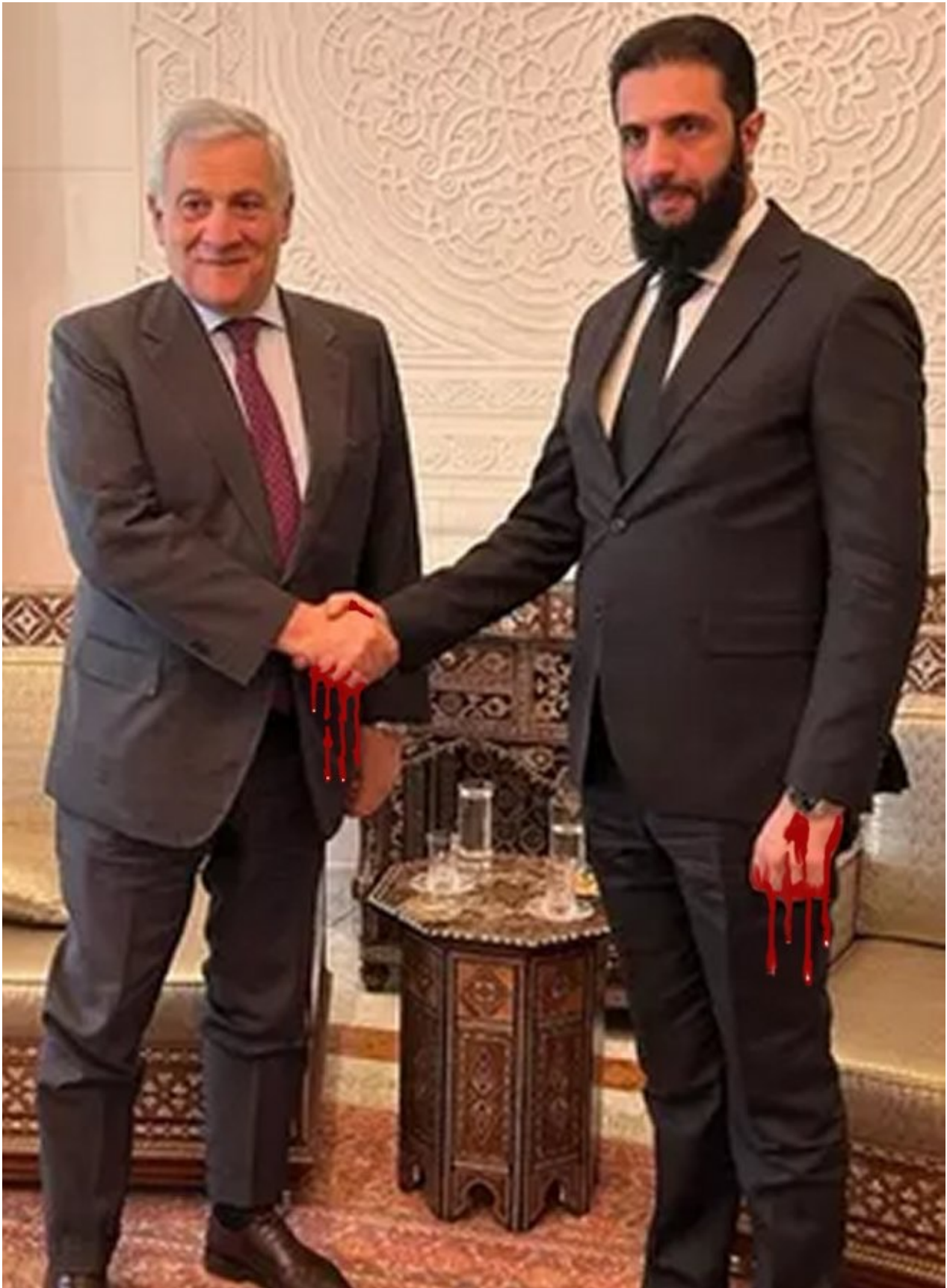
Il vicepremier Tajani con l'ex tagliagole jihadista Al Jolani

Il summit UE avviene a distanza di pochi giorni dal massacro degli Alawiti siriani che rivendicavano un ruolo politico nel nuovo governo creato dopo il golpe dei jihadisti armati dalla NATO dall'ex tagliagole di ISIS e Al Qaeda , il leader dei terroristi HTS Al Jolani che oggi si fa chiamare col vero nome Ahmed Al Shara.