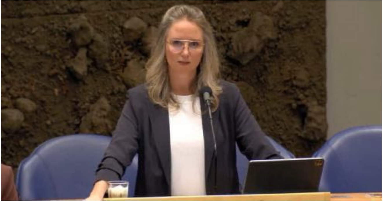
il ministro della Salute olandese, Fleur Agema

Questa dichiarazione evoca la famigerata pubblicazione della fondazione Rockefeller intitolata “Operazione Lockstep” , dove il termine “lockstep” sta a significare “a tappe serrate”