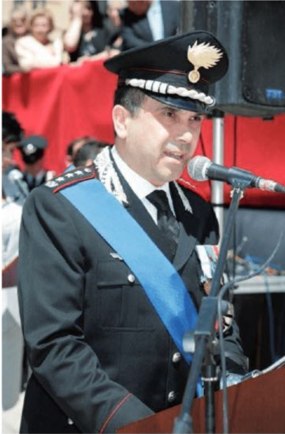
Il generale dei CC, Francesco Bonfiglio

A far notare la strana incongruenza sull'ultimo punto in questione è stato, tra gli altri, il sito Presskit che ha osservato correttamente come il Punto Nato UEO de dipartimento della protezione civile sulla carta non dovrebbe più esistere dal 2011, poiché le sue funzioni avrebbero dovuto cessare per essere trasferite invece all'Unione europea, ma invece apprendiamo che da tale verbale tale passaggio di consegne non risulta essere ancora avvenuto.