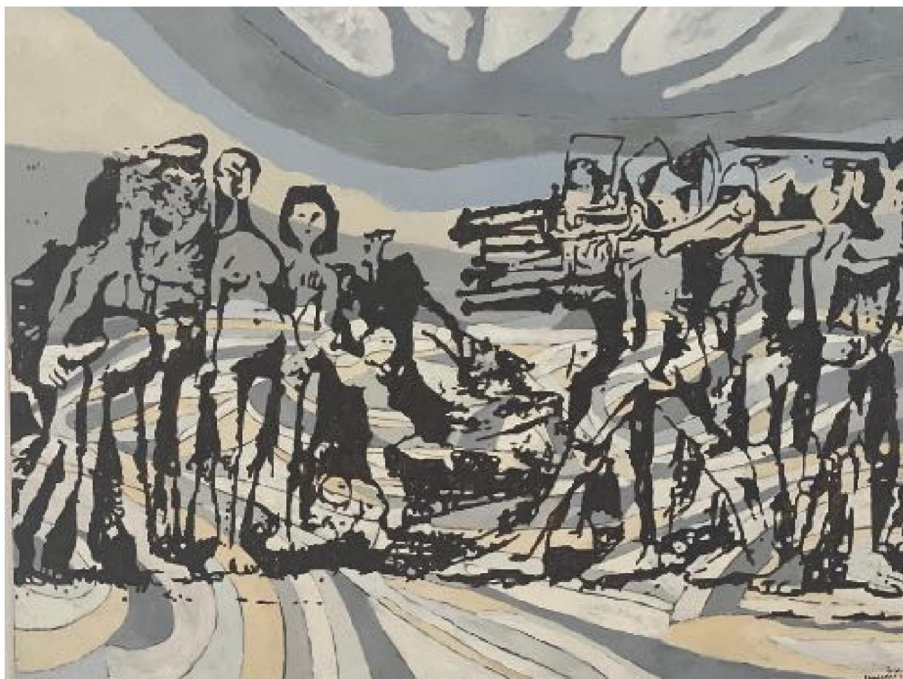
"Across the Borderline", 2016, di Fouad Agbaria.

Si prega di inserire un indirizzo email valido