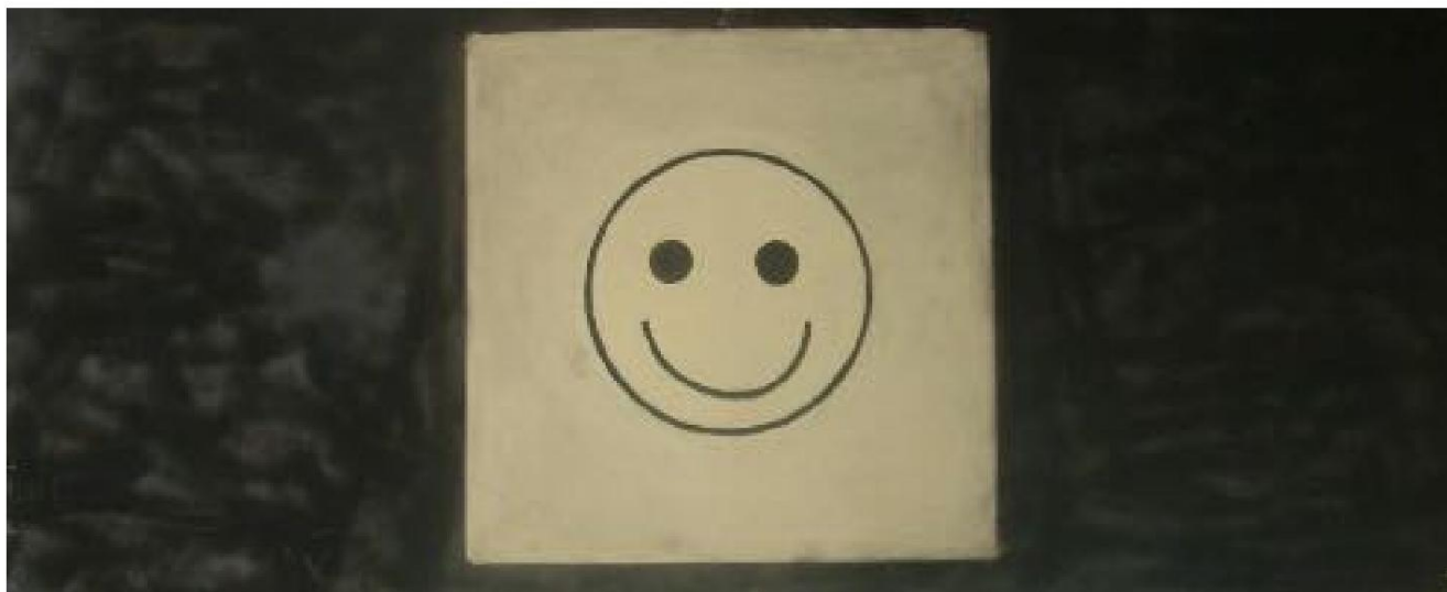
Senza titolo, 2003, di Fouad Agbaria.

Più o meno contemporaneamente all'adozione della risoluzione, la polizia aveva annunciato all'inizio di questo mese che, in seguito a un appello del Ministro della Cultura e dello Sport Miki Zohar, al teatro Al-Saraya di Jaffa era stato vietato di proiettare il documentario "Lyd", nonostante il film non sia vietato e non richieda un'autorizzazione per la proiezione.