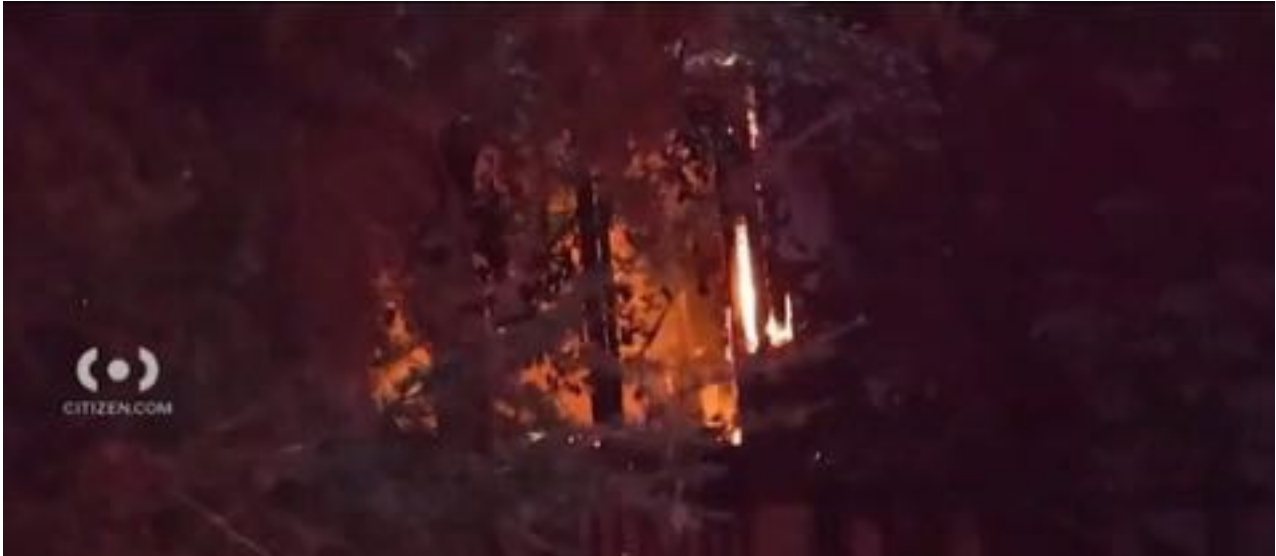
La casa di Will Rothschild in fiamme

Will veniva descritto come un tipo molto riservato, uno di quelli che amava condurre uno stile di vita lontano dai riflettori dei media.