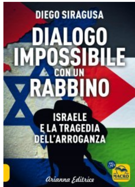
Dialogo impossibile con un rabbino - Libro

Un mondo nuovo e coraggioso è già arrivato. È in giro.