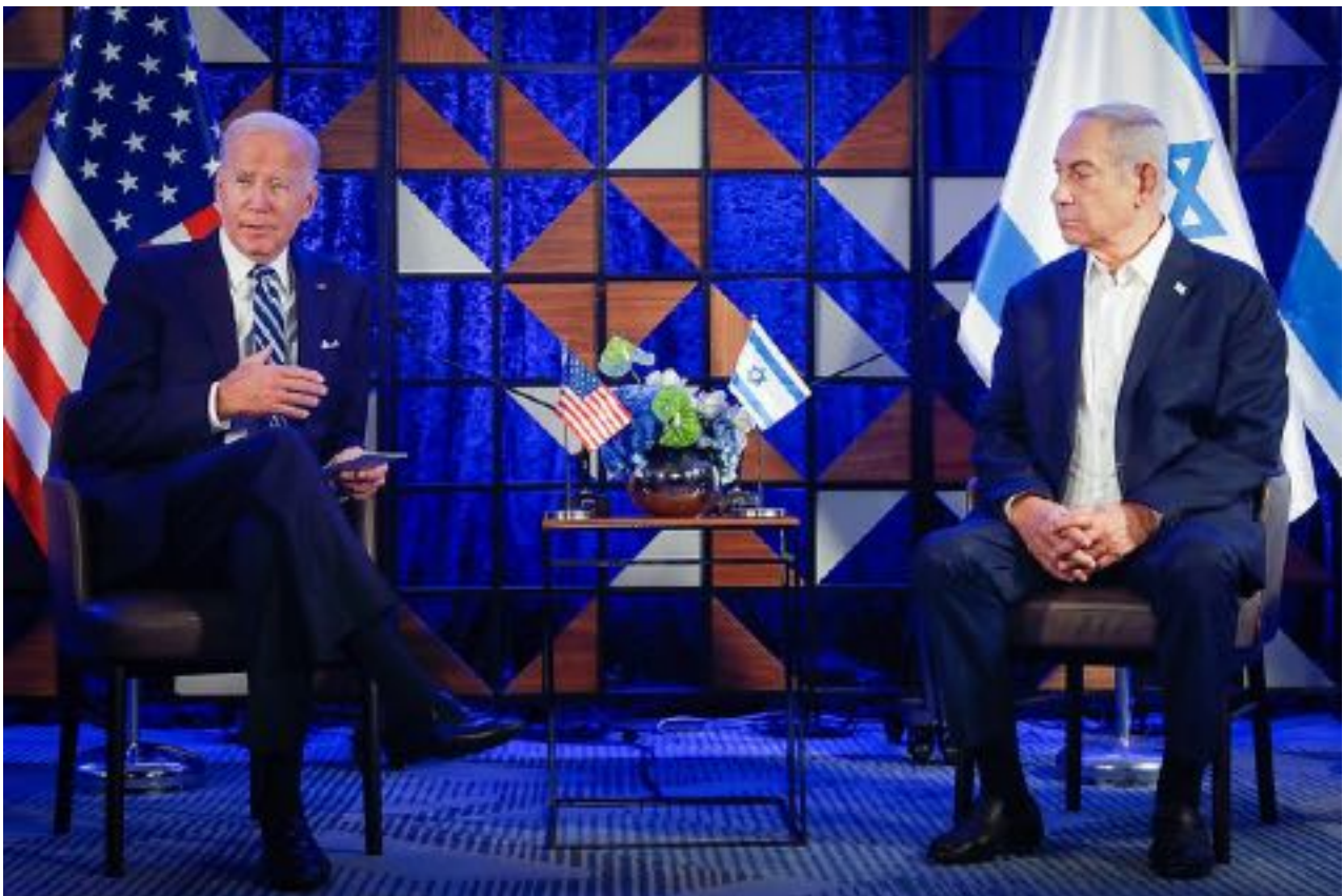
Il primo ministro israeliano Benjamin Netanyahu incontra il presidente degli Stati Uniti Joe Biden a Tel Aviv, 18 ottobre 2023.

Il netto rifiuto da parte della Casa Bianca dei mandati della CPI è un segnale pericoloso. Incoraggia Israele a continuare le sue politiche di occupazione, espansione degli insediamenti e aggressione militare con la garanzia della protezione americana. Inoltre, scoraggia altre nazioni dal cooperare con la CPI per paura di ripercussioni politiche.