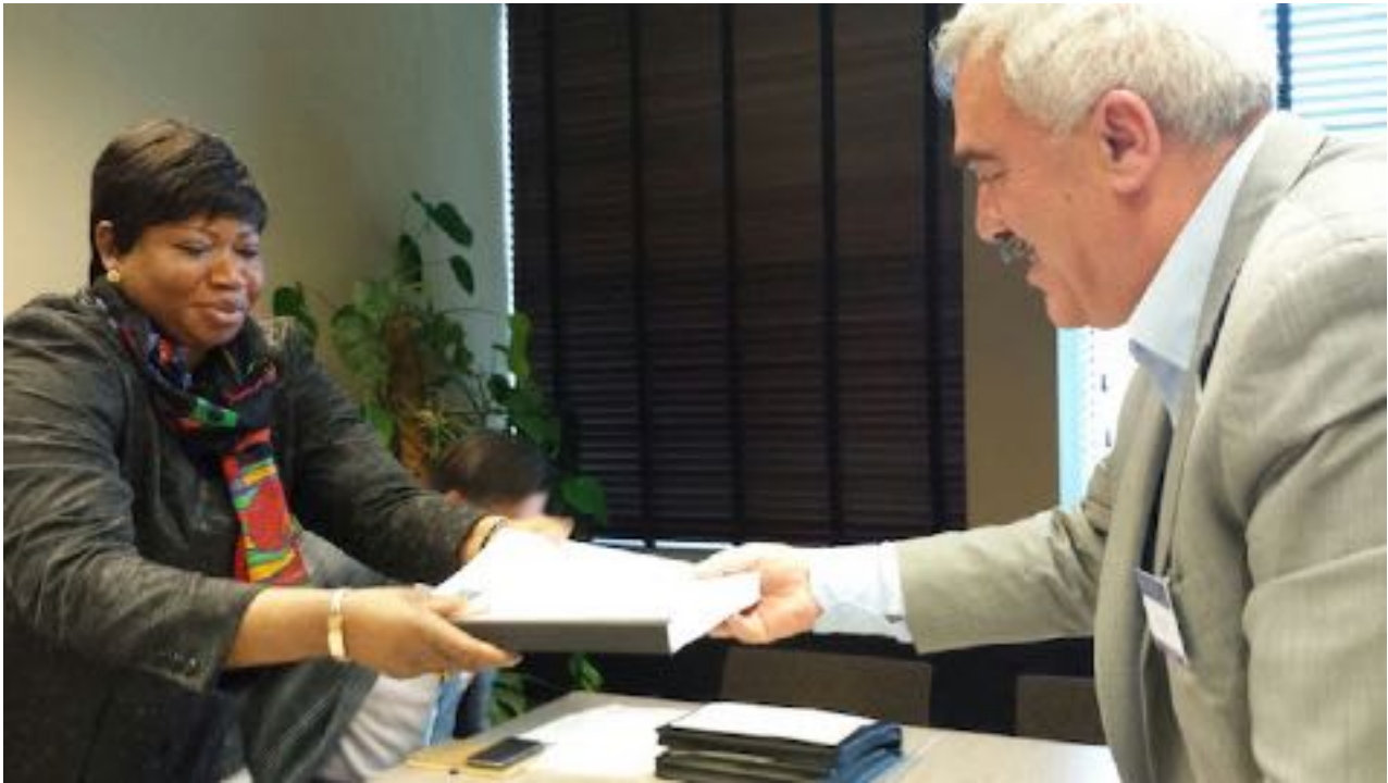
Il direttore di Al-Haq Shawan Jabarin consegna una comunicazione riservata al procuratore della CPI Fatou Bensouda all'Aia, il 23 novembre 2015.

La natura continua di questi crimini assicura che l'indagine si espanderà. Le conclusioni della CPI finora hanno solo scalfito la superficie. La corte sta costruendo un quadro legale completo che probabilmente implicherà altri funzionari di alto rango e comandanti militari. Si tratta di un processo lungo, ma le implicazioni sono di vasta portata.