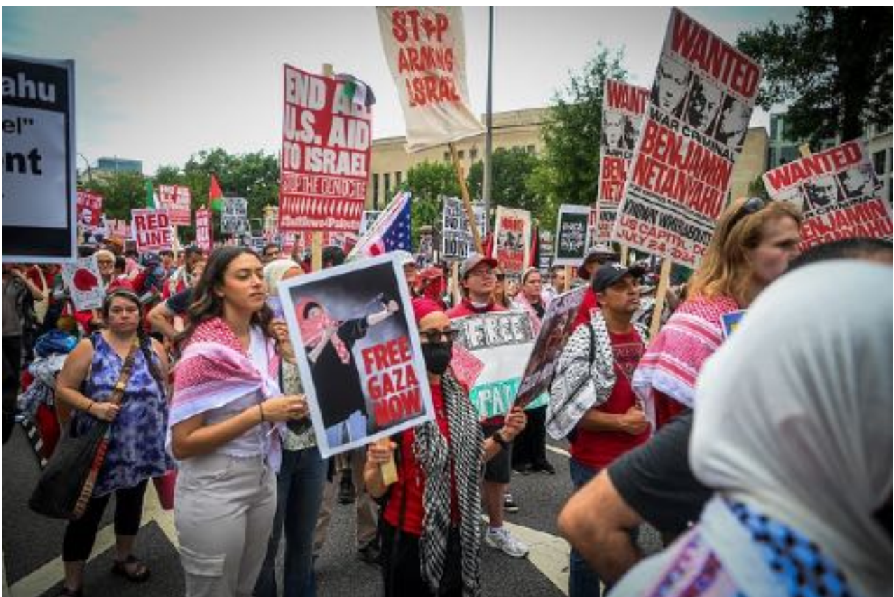
Manifestanti pro-palestinesi a Washington protestano contro il primo ministro Benjamin Netanyahu durante il suo discorso al Congresso degli Stati Uniti, 24 luglio 2024.

Sebbene ciò sia più facile a dirsi che a farsi, la pressione sostenuta dei movimenti globali può modificare il calcolo politico nel tempo. Anche negli stati con forti legami politici con Israele, l'opinione pubblica e la pressione popolare potrebbero rendere la non conformità politicamente costosa.