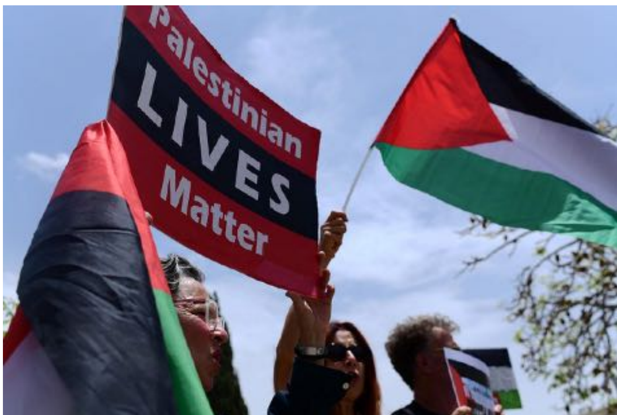
Studenti palestinesi protestano contro un disegno di legge che vieterebbe di sventolare bandiere palestinesi nelle università israeliane, presso l'Università di Tel Aviv, 28 maggio 2023.

Eppure, quando si tratta della Palestina, la stessa urgenza è palesemente assente. Per decenni, i palestinesi hanno dovuto affrontare violenza sistematica, sfollamenti e occupazione, ma la risposta internazionale è stata, nella migliore delle ipotesi, tiepida. Le richieste di sanzioni contro Israele o di responsabilità legale per i suoi leader incontrano resistenza, spesso liquidate come motivate politicamente o antisemite.