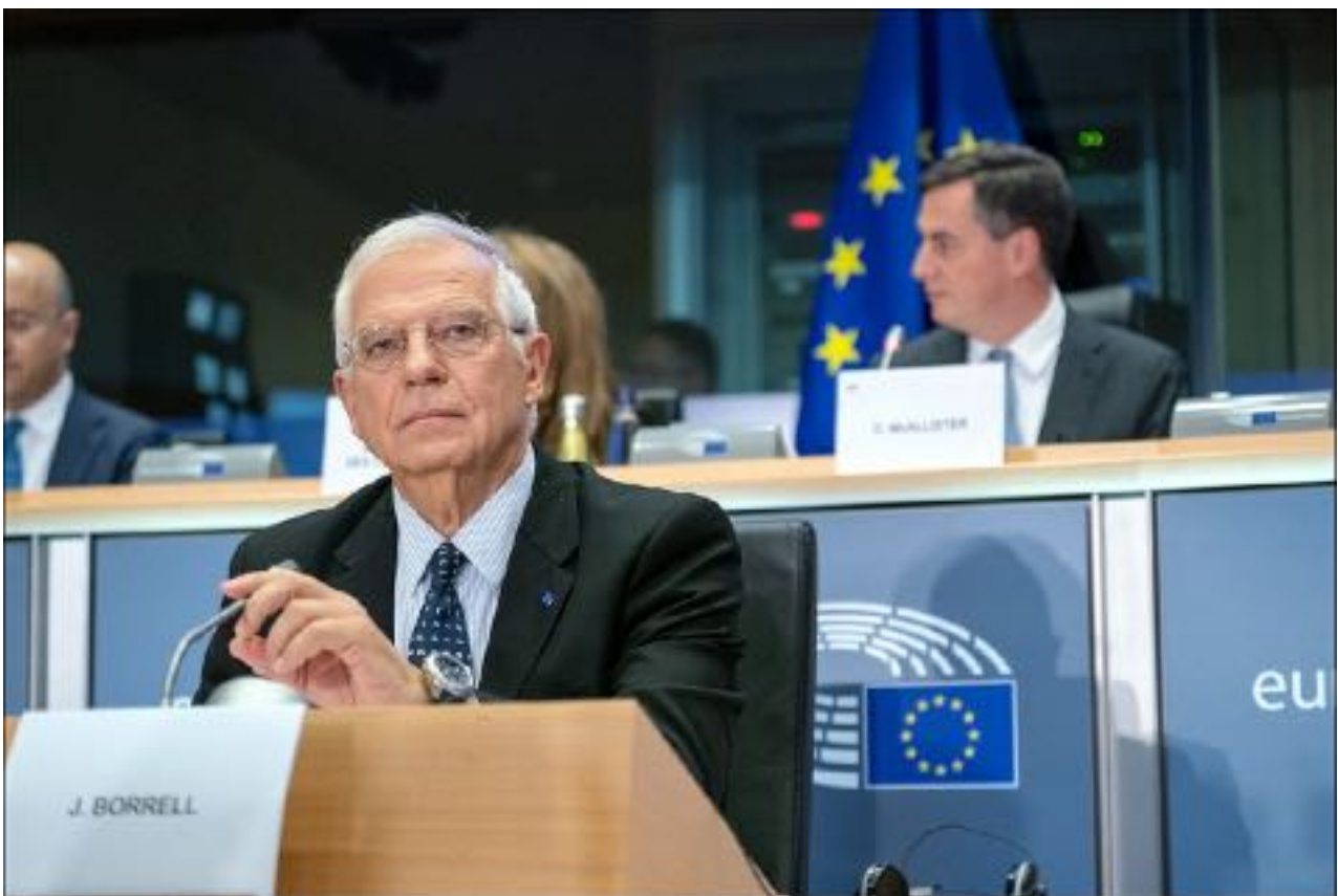
Josep Borrell, durante la sua audizione per la carica di Alto rappresentante dell'Unione per gli affari esteri e la politica di sicurezza dell'Unione europea, 7 ottobre 2019.

Nel caso di Netanyahu e Gallant, molto dipenderà da dove andranno, cosa su cui ora devono riflettere attentamente. Le reazioni iniziali ai mandati sono state incoraggianti, con diversi paesi e organizzazioni che hanno ribadito il loro impegno per la giustizia internazionale. L'Unione Europea, con tutti i suoi 29 stati membri vincolati dallo Statuto di Roma, ha indicato tramite Josep Borrell [l'Alto rappresentante dell'UE per gli affari esteri e la politica di sicurezza] che sono obbligati ad agire in base a questi mandati. Tuttavia, le ramificazioni politiche dell'arresto di funzionari israeliani in carica o in servizio da poco potrebbero scoraggiare anche gli stati più impegnati.