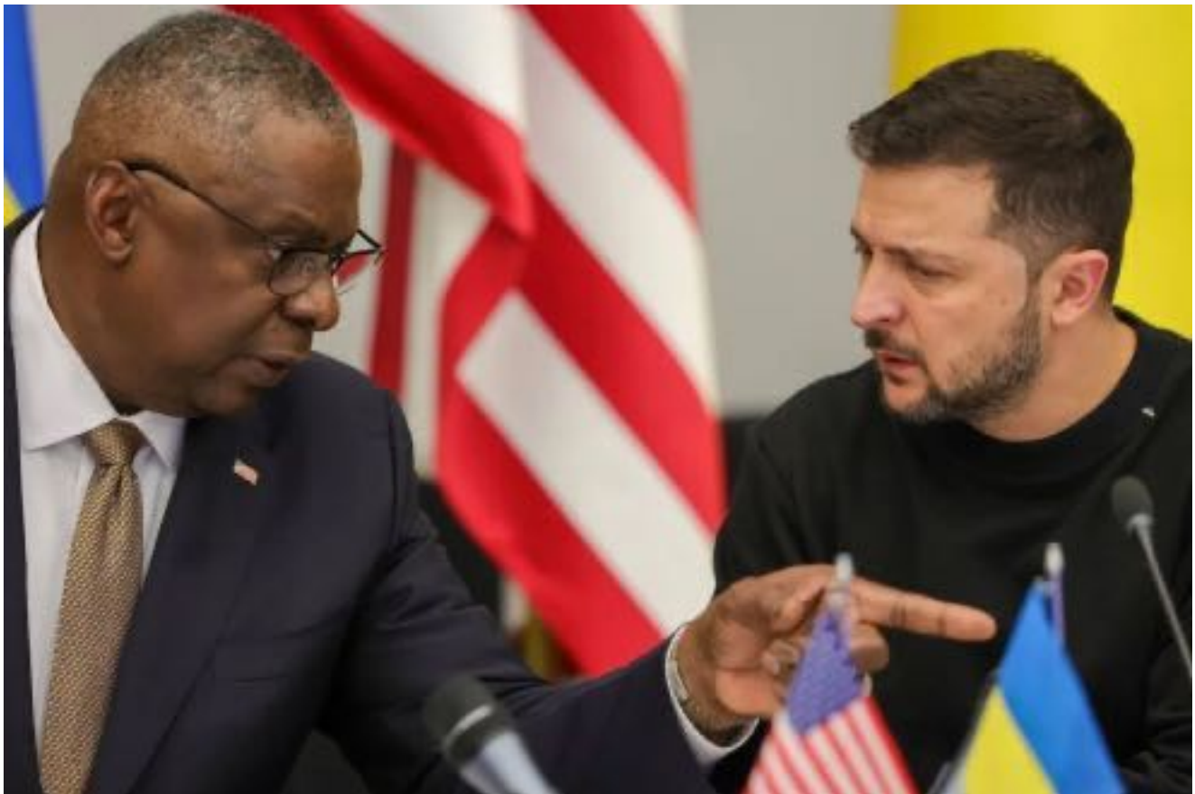
Il capo del Pentagono Lloyd Austin con Zelensky

Questo è un'incredibile eco della storia in cui i carri armati tedeschi, britannici e americani stanno saccheggiando il suolo russo e terrorizzando città e villaggi. Inoltre, ci sono resoconti attendibili che la fanteria nemica è composta da forze speciali della NATO provenienti da Stati Uniti, Gran Bretagna, Francia e Polonia insieme ai neonazisti dell'Ucraina.