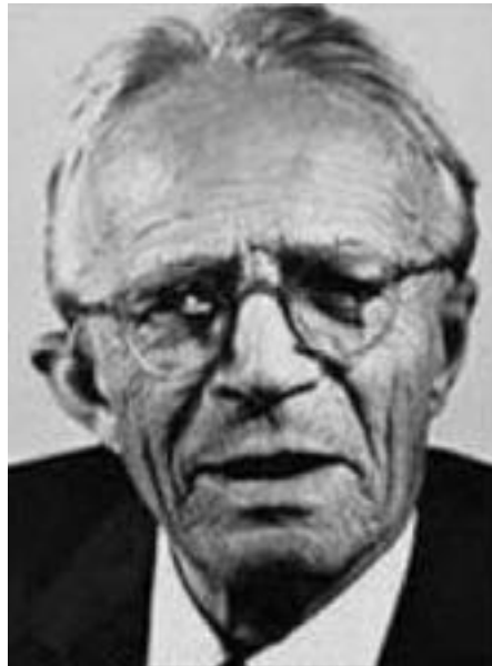
W. O. Schumann

Navigando in rete mi ha colpito questa notizia “In Neurologia la reazione 12-15 Hz è chiamata frequenza Sensory-Motor Rhythm (SMR).