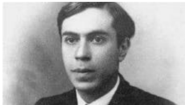
Ettore Majorana, scomparso nel 1938

Tuttavia la vita moderna, con il suo progresso tecnologico, ha dato il via ad una grande quantità di campi elettromagnetici di discreta potenza, come reti cellulari, televisioni, radio, linee ferroviarie, metropolitane, senza contare apparati militari (su cui sappiamo poco o nulla) ed il 5G in arrivo con potenze enormi. Tutte queste vibrazioni artificiali innaturali vanno ad interferire con le energie esistenti, con il rischio di creare alterazioni e distonie anche consistenti.