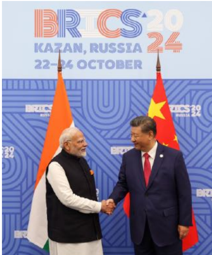
L'incontro bilaterale Cina – India

In generale, uno dei risultati più rilevanti di questi vertici sembra essere proprio quello di contribuire a tessere relazioni bilaterali più strette tra i paesi aderenti, sfruttando il canale sempreverde delle relazioni personali dirette tra i leader, che in tali occasioni si parlano senza filtri in colloqui one-to-one dove più facile sembra affrontare anche vecchie ed irrisolte questioni tra i paesi, così come accennare, lontano dai riflettori, temi strategici e delicati, cui un'eccessiva pubblicità potrebbe nuocere. Che poi è quanto accade, in misura molto più grande e con un grado di segretezza decisamente più alto, e tra partecipanti meno "ufficiali" (ma non per questo meno potenti, anzi) alle riunioni dei vari Bilderberg, Trilateral etc. E le conseguenze di questi incontri non hanno tardato di farsi sentire, come dimostra il fatto che il primo paese a condannare la rappresaglia israeliana verso l'Iran sia stata l'Arabia Saudita.