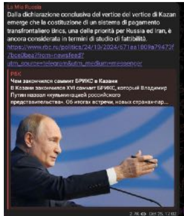
Putin sulla futura moneta BRICS