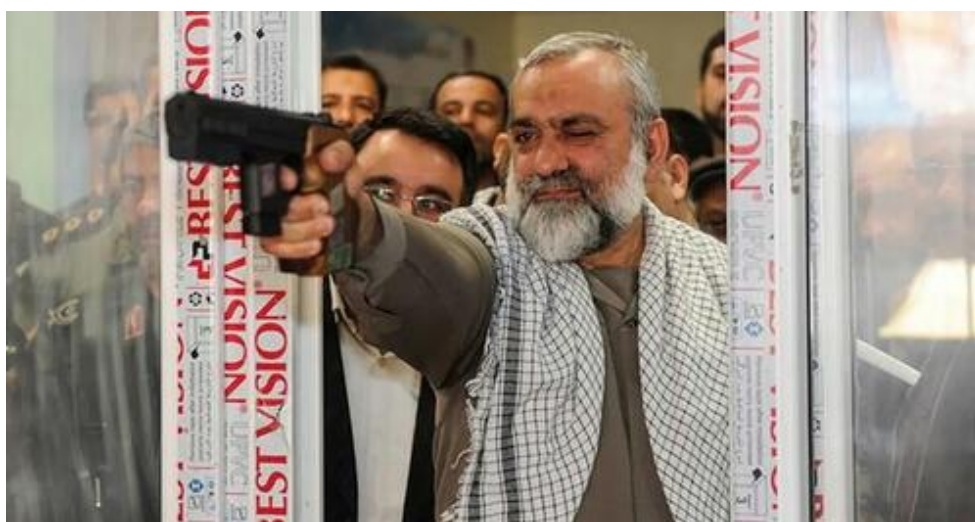
Brigantino iraniano. Gen. Mohammad Reza Naqdi, tramite Iran International

Ma la stessa Teheran sta ora esercitando pressioni sulla Casa Bianca, provocando apertamente Biden in relazione al suo sostegno a Israele. In una dichiarazione di sabato il governo iraniano ha minacciato che il Mar Mediterraneo potrebbe essere "chiuso" a causa dei "crimini" israeliani e statunitensi in corso a Gaza. La minaccia è significativa : se riusciranno mai a realizzare una cosa del genere è tutta un'altra questione.