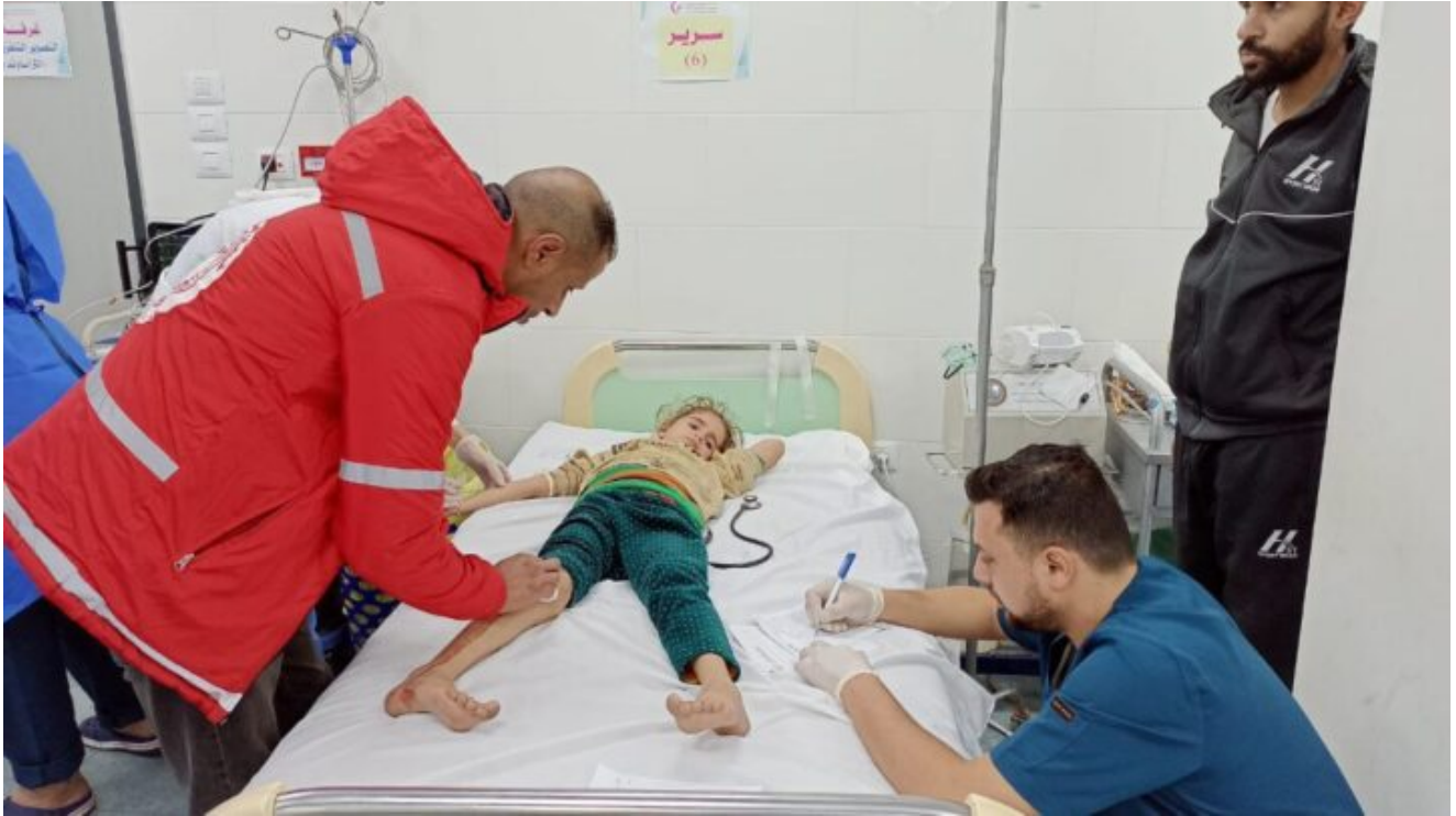
(Foto: vittime e decine di feriti nel bombardamento da parte dell'occupazione della residenza della famiglia Al-Hams a Rafah, nel sud della Striscia di Gaza).