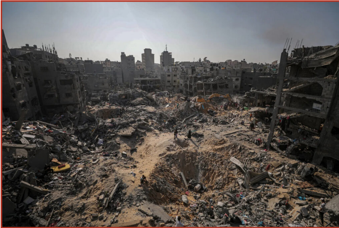
Macerie di un campo profughi colpito da un attacco aereo nel nord

“[...] Secondo un calcolo fatto dalle Nazioni Unite sulle morti verificate di bambini nel corso dei conflitti, a Gaza dall’inizio dell’attacco israeliano sono stati uccisi più bambini che in tutti i più importanti conflitti del mondo messi insieme – due dozzine i paesi in questione – nel corso di tutto lo scorso anno, guerra ucraina compresa”.