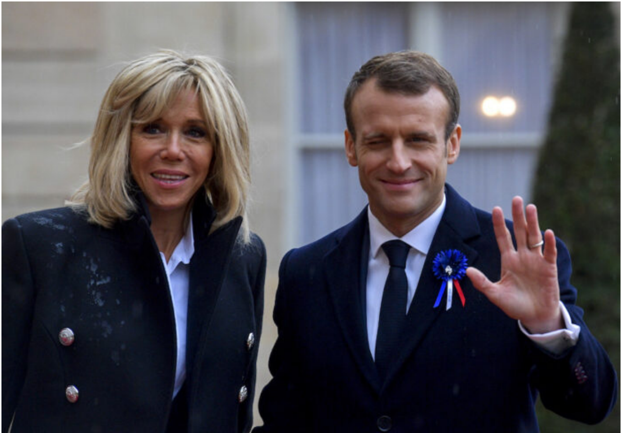
Brigitte ed Emmanuel Macron