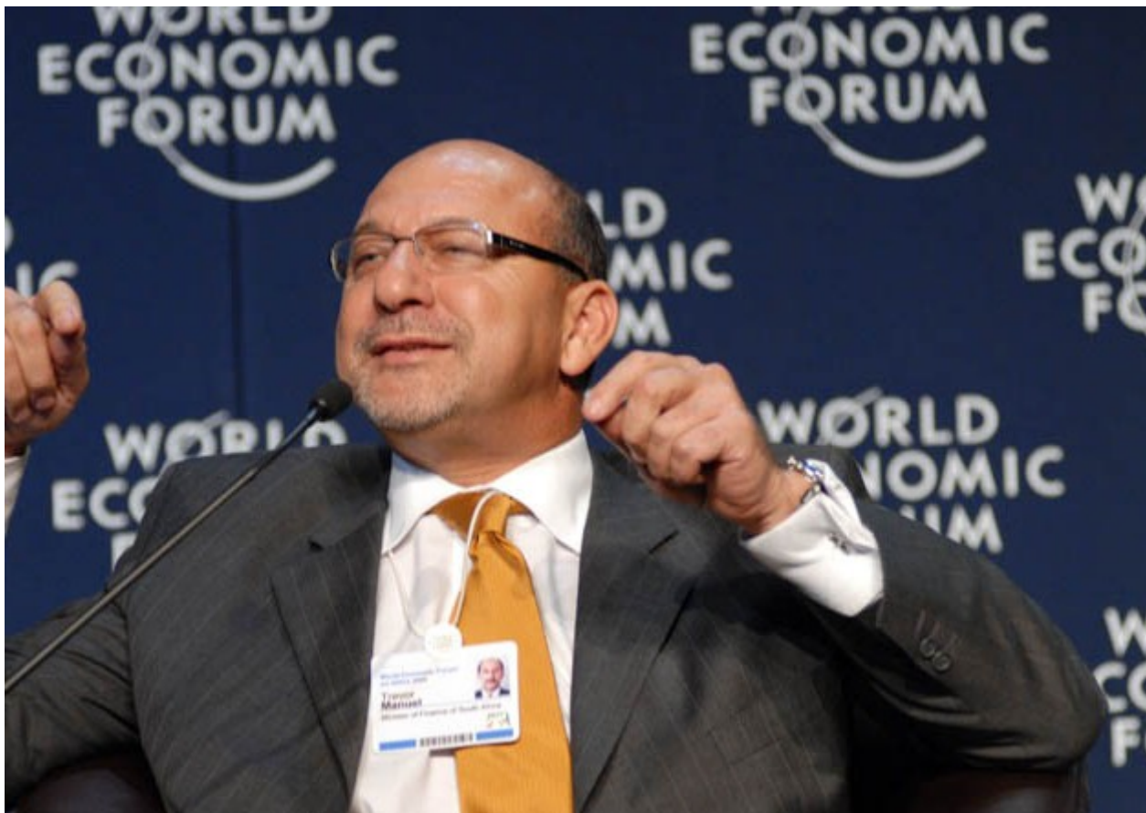
L'ex ministro sudafricano Trevor Manuel al World Economic Forum