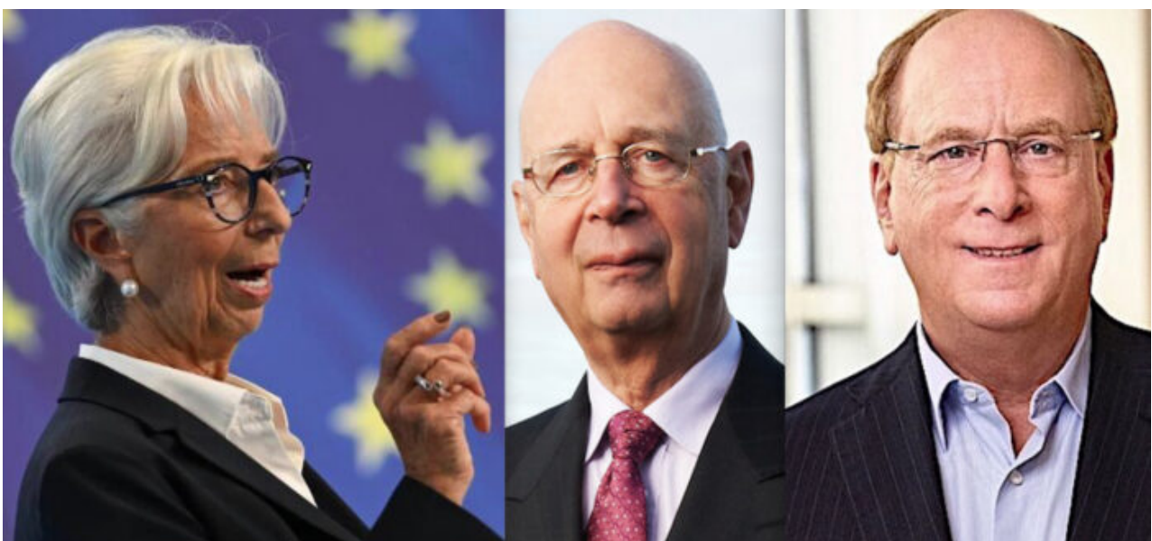
Christine Lagarde. Klaus Schwab, Larry Fink