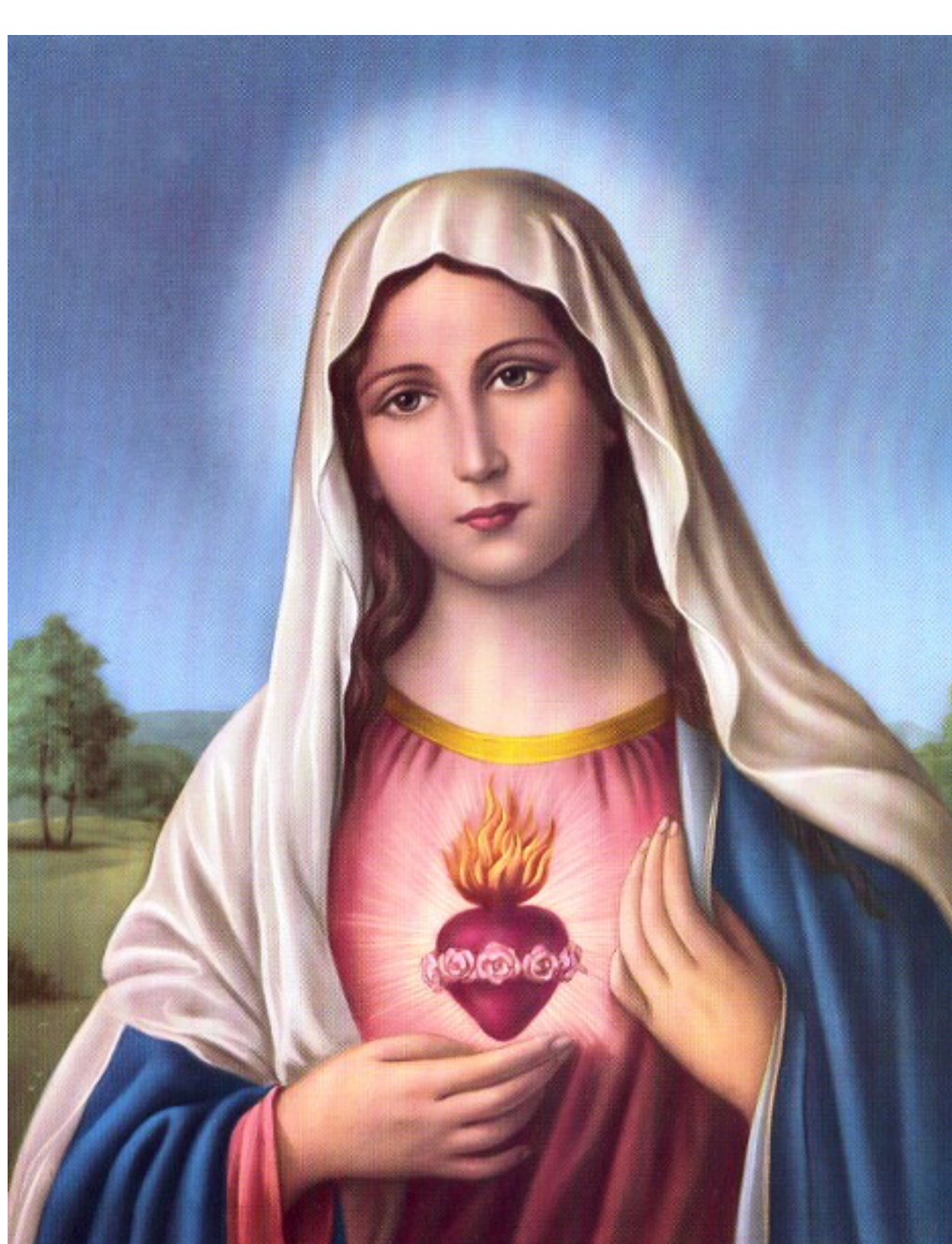
"Cuore Immacolato, difendici!"

Da giugno 2022 è presidente del Defense Innovation Board, un comitato consultivo indipendente che fornisce raccomandazioni su intelligenza artificiale, software, dati e modernizzazione digitale al Dipartimento della Difesa degli Stati Uniti.