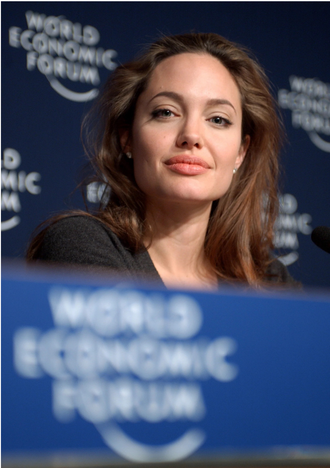
Angelina Jolie - World Economic Forum Annual Meeting Davos 20

"L'incontro di quest'anno potrebbe riuscire a compiere qualche progresso in materia di clima, ma molti sostengono che il forum sia irrilevante in un mondo cambiato"