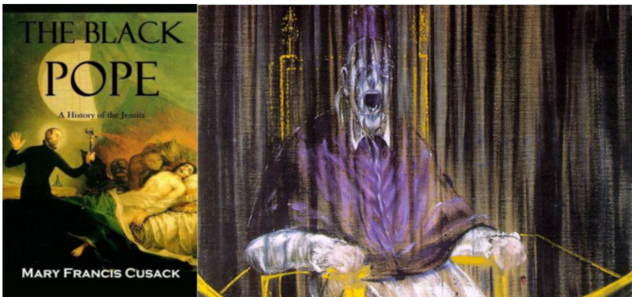
DX: Francis Bacon, "Papa Delirante", 1953; Studio dal Ritratto di Papa Innocenzo I di Velasquez (dettaglio)

coincidente ( chissà perché ) con quello... 'Bianco' -al più insignificante dei Parroci di Borgata. Per non parlare degli immancabili 'Parenti & Amici' di turno, pronti a venire aizzati contro di te in perfetto copione "Big Brother".