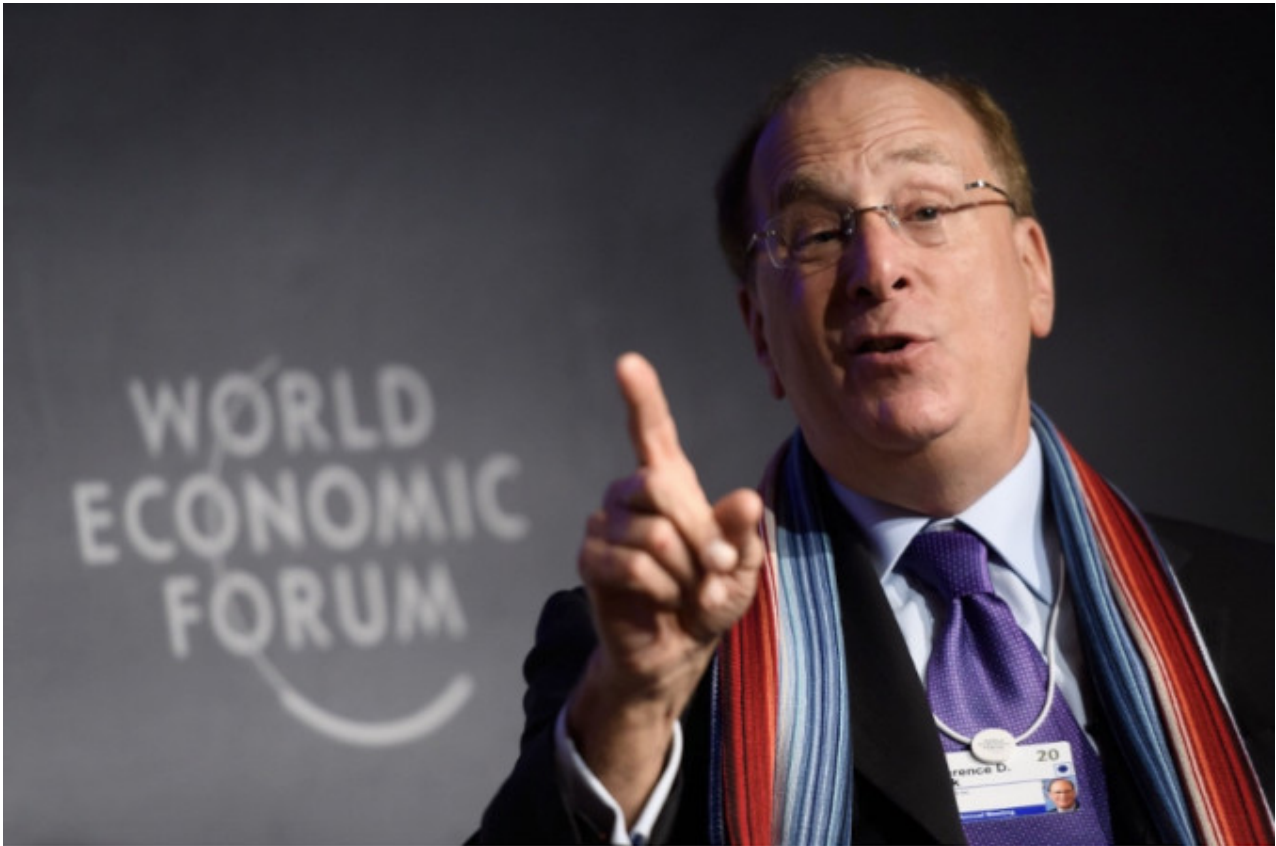
Larry Fink, 'Eletto' AD dell'assai... 'Eletta' "BlackRock", in ghingheri presso l'amato "W.E.F."

M.B.: «Nel “Libro dei Proverbi” (22: 7) è specificato con la massima chiarezza [e la 'Crisi Esistenziale' di cui scrive Viganò sembra mettere ancor più in evidenza questo concetto]: «Il Ricco domina sui Poveri e il Debitore è...Schiavo del Creditore» . Ora... Questa è una frase a dir poco emblematica , in particolare se la colleghiamo a quelle esaminate in precedenza. Attraverso di essa, possiamo comprendere assai bene il Sistema del 'Debito/Credito' che a tutt'oggi ci attanaglia. Ecco perché, in tutta franchezza, non so se sia possibile nutrire la speranza che ha [ottimisticamente] espresso Monsignor Viganò : «Dalla nostra parte c'è il Signore Onnipotente, il Dio degli Eserciti Biblico». Sì, perché in realtà è... proprio questo 'Dio degli Eserciti Biblico' che ha minuziosamente descritto ed implementato una siffatta Forma di Governo e di Controllo e -in generale- questa precisa Strategia finalizzata a soggiogare Popoli e Nazioni».