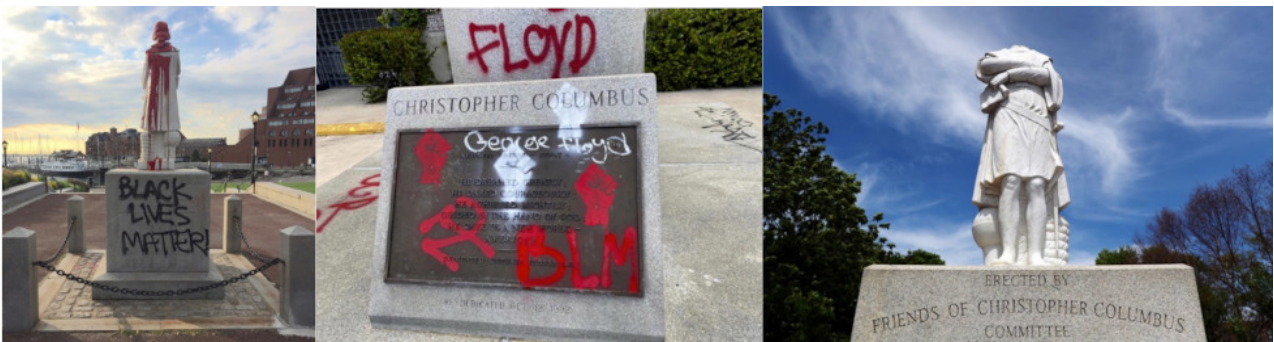
U.S.A., 2020: Statue di Cristoforo Colombo vandalizzate da “B.L.M.” in onore del...‘Martire’ di Turno, nel turpe nome della...‘Cancel Culture’

Il Sionismo Internazionale , che sta rigorosamente dietro a... tutte queste operazioni di segno ‘Anti-Occidentale’, se solo potesse eliminarrebbe in un sol colpo l’Uomo Bianco Europeo dalla Faccia della Terra . E bisogna dire che, purtroppo, tra Immigrazione ‘Orchestrata’ dal Terzo Mondo, Sommosse Ad Hoc ‘Neri-contro-Bianchi’, imminente Crash Finanziario da “C-19” e da...‘Guerra’ ai danni della Classe Media e sua sempre-più incalzante Schiavitù* da Debito, Campagne Denigratorie d’ogni tipo -oltre ad una Propaganda Mediatica che più... aggressiva , nei confronti di noi “Discendenti di Amalek”, non potrebbe essere- detto Sionismo sta facendo davvero un... eccellente lavoro.