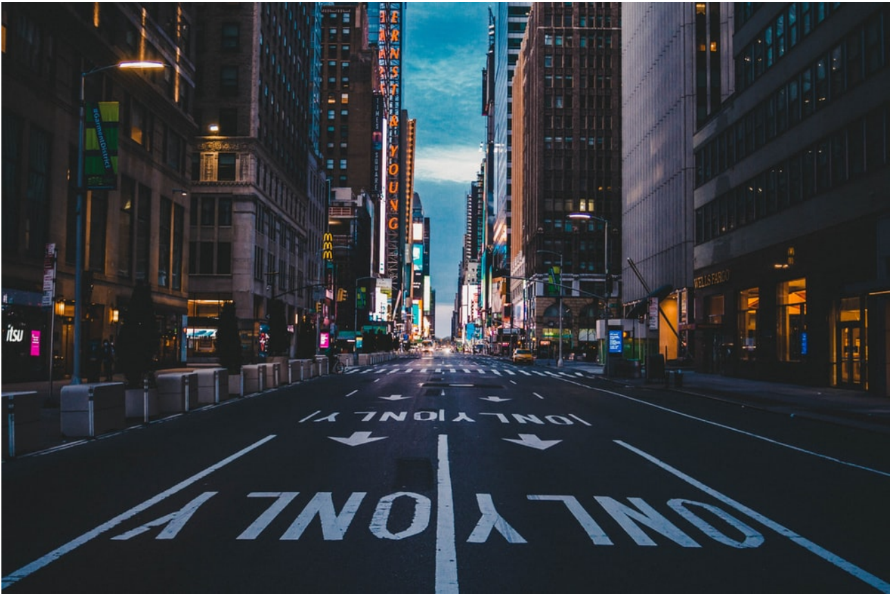
New York City e il lockdown.