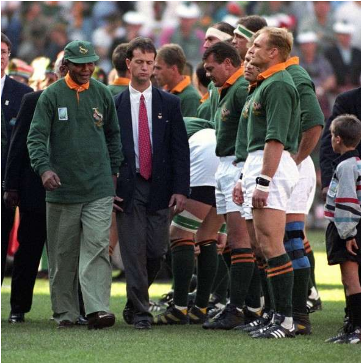
Mandela prima della finale della Coppa del Mondo di rugby del 1995 con la maglia degli springboks

“Non si può cedere alla brutale invasione russa. Si consegnerebbe al massacro la popolazione ucraina”, questo l'assunto che obbligherebbe Kiev ad accettare il terreno della guerra.