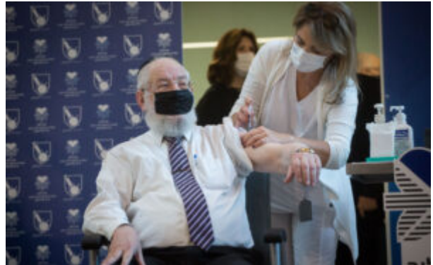
Rabbi Yisrael Meir Lau receives a Covid-19 vaccine, at Tel Aviv Sourasky Medical Center (Ichilov), on December 20, 2020. *** בישראל נגד נהקורונה

California! Lo stato più progressista degli Stati Uniti! Ebbene, il suo governo è infestato di pidocchi prezzolati da Putin: hanno interrotto la somministrazione con la scusa di effetti collaterali – battono la fiacca e indeboliscono la fiducia nella scienza. Per questi ci vuole il colpo alla nuca.