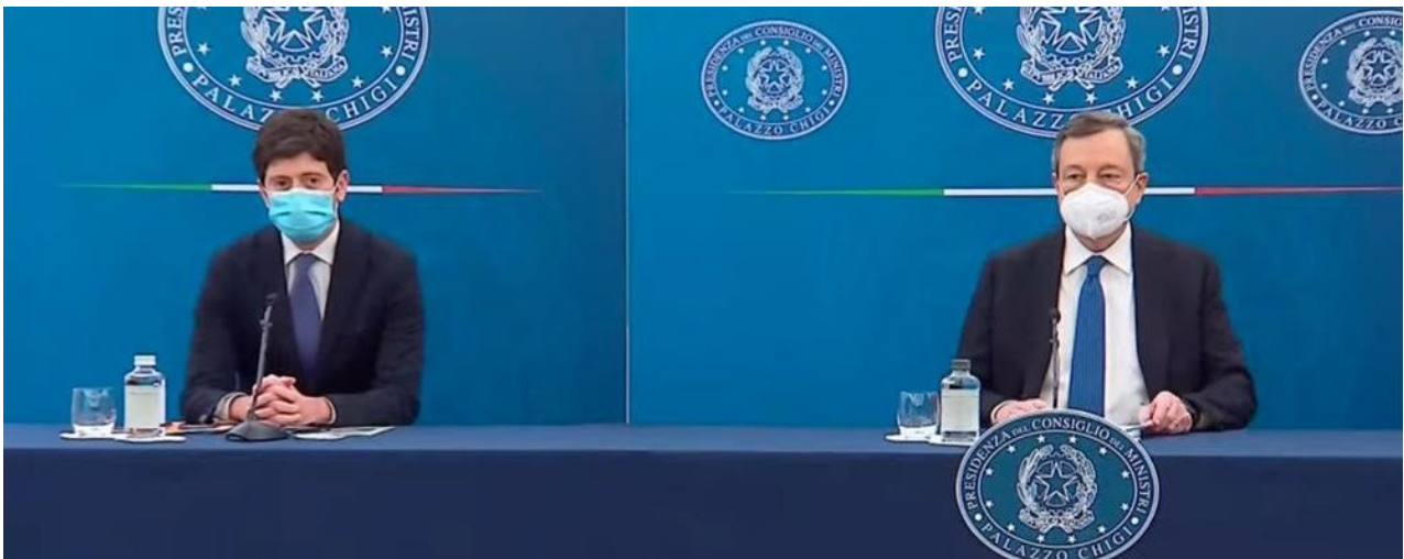
Speranza e Draghi i due responsabili della campagna vaccinazioni

Alcuni hanno giustamente rilevato, con meraviglia, che, nel decreto legge del 23 luglio, sussiste una vistosa contraddizione. Infatti, mentre l'articolo 4 prescrive il Green Pass, l'articolo 9 prescrive di rispettare la Direttiva europea che proibisce trattamenti differenziali tra vaccinati e non vaccinati (Risoluzione 2361/21 del Consiglio d'Europa e Regolamento 953/2021 n. 36 del Parlamento Europeo), quindi esclude il Green Pass. Perché mai il governo ha fatto una tale apparente assurdità?