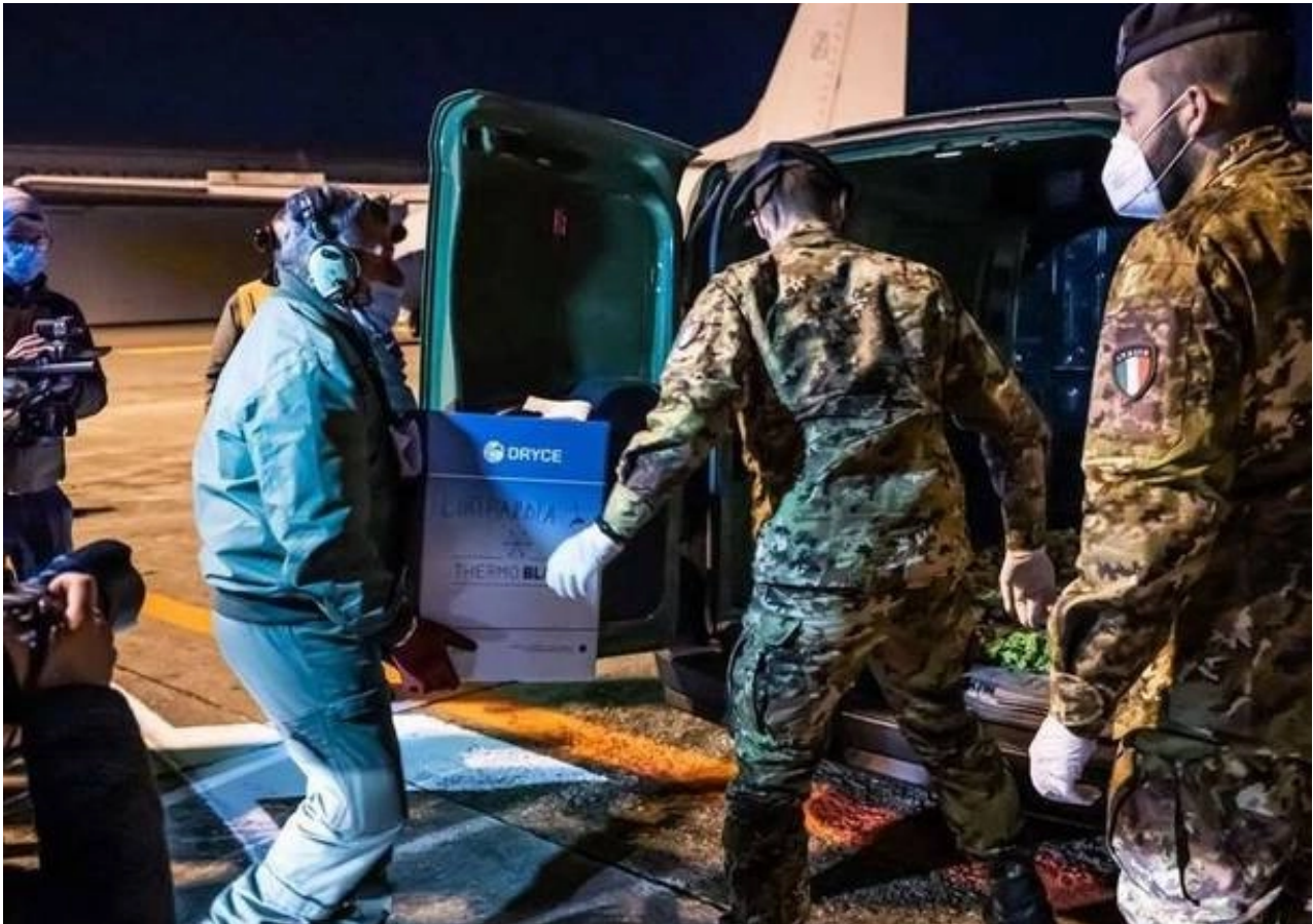
Campagna Vaccinazione militarizzata

avversi anche mortali non vengono così evitati. Non importa. Già decine di migliaia di persone sono state freddamente uccise col protocollo della vigile attesa e del paracetamolo, e subito cremate senza autopsia per nascondere questo genocidio, necessario per creare terrore del virus e consenso alla vaccinazione forzata in fase sperimentale. Anche l'Istituto Superiore di Sanità dà il suo contributo: per rassicurare il popolo cavia, il 7 Agosto ha ufficialmente dichiarato che i 'vaccini' non sarebbero sperimentali, mentre persino il Senato, con l'atto di sindacato ispettivo nr 100388/2021, ha accertato che sono in fase sperimentale.