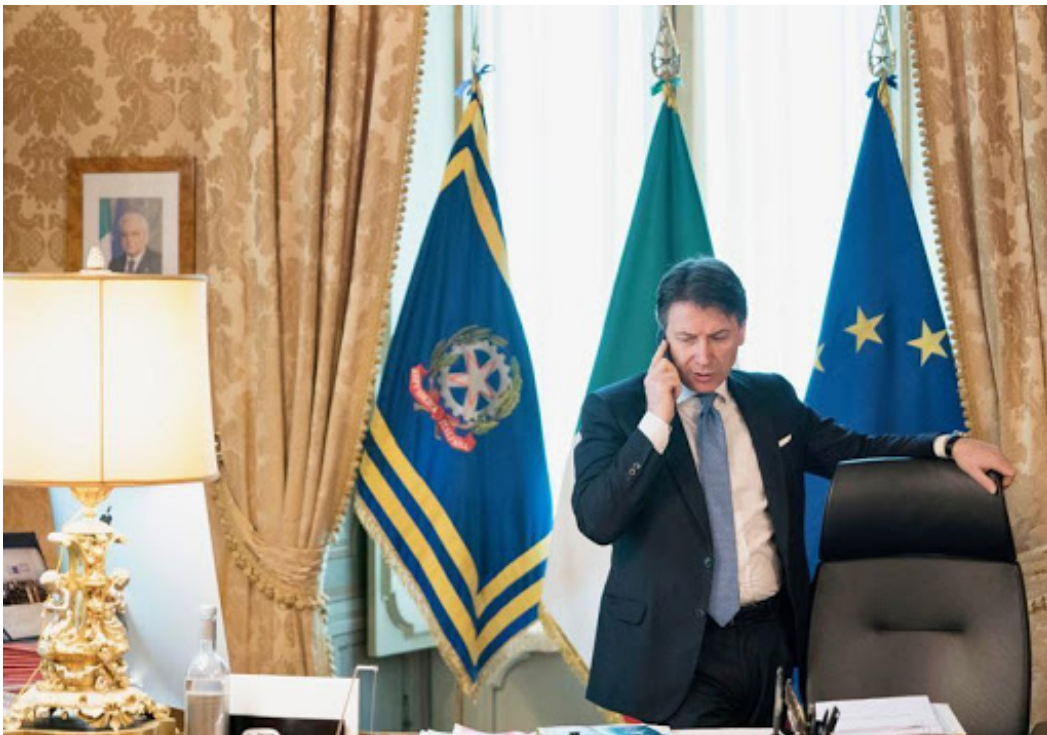
Tricolore scomparso. Ora c'è, cosa? il vessillo di guerra della Squadra e Compasso? . Tutto blu.

Infatti, rincarare il comunicato firmato da Conte-Malthus, “ Se riusciamo a sviluppare un vaccino prodotto dal mondo, per tutto il mondo, questo sarà un bene pubblico globale unico del 21 ° secolo. Insieme ai nostri partner, ci impegniamo a renderlo disponibile, accessibile e alla portata di tutti”.