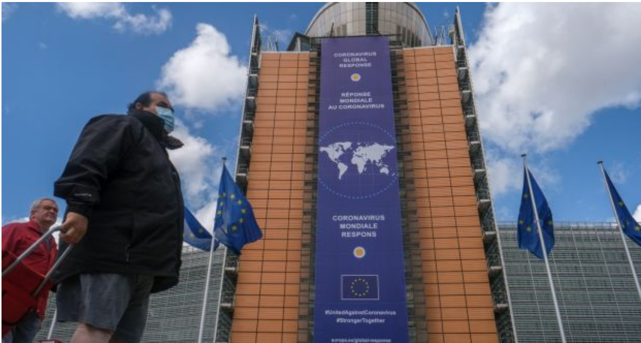
L'immensa striscione che annuncia la Global Risposta al Covid sul palazzo della Kommissija Europea.

Dopo il dovuto omaggio al " sacrificio e agli sforzi eroici del personale medico e assistenziale", la autorità maltusiana globale arriva al dunque: