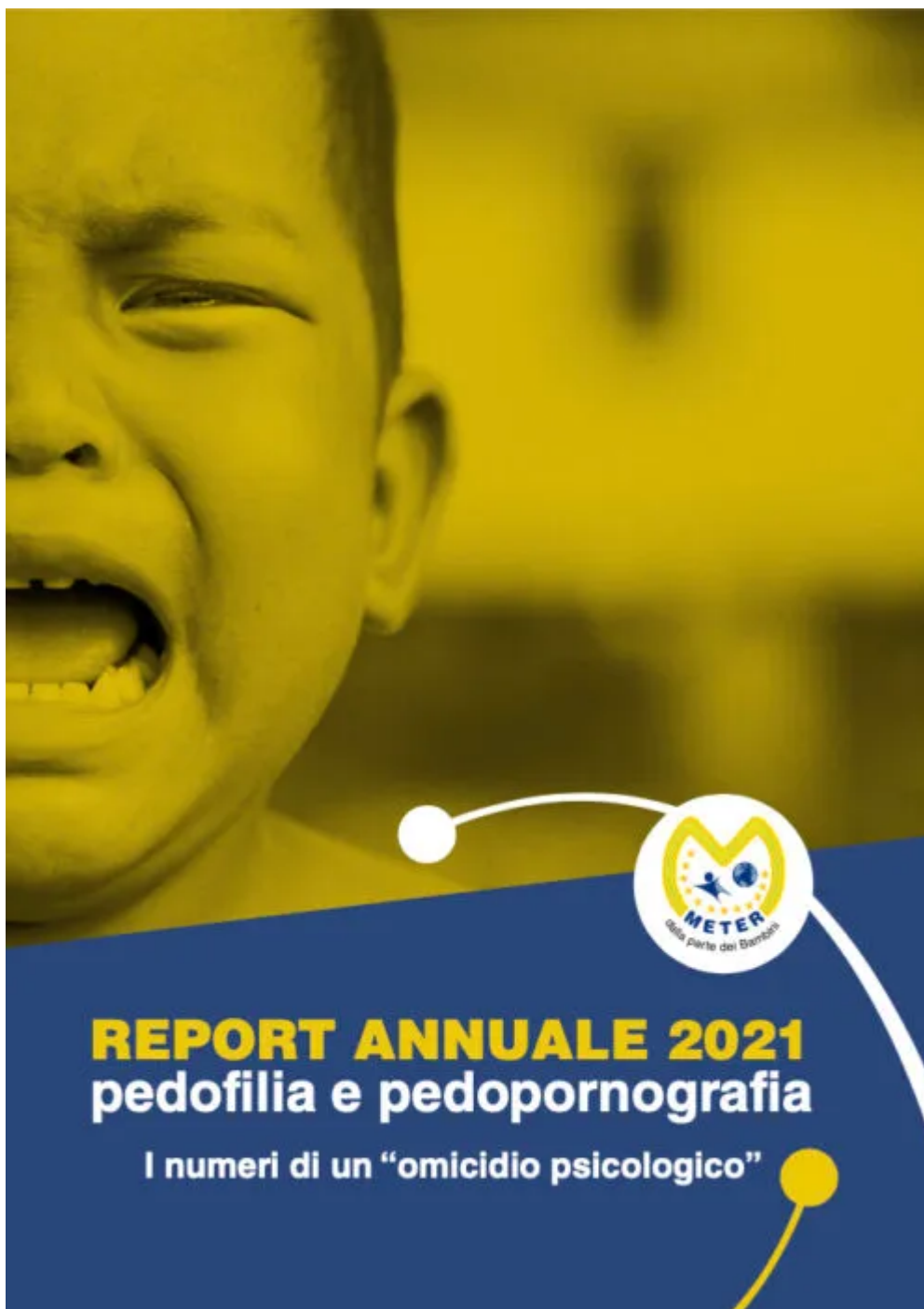
Il dossier dell'associazione Meter sulla pedofilia

L'argomento principale di cui i professionisti Meter si sono occupati, anche nel 2021, riguarda la pedofilia e le insidie della rete: l'analisi dei profili di pedofili e vittime, le dinamiche del fenomeno, gli aspetti psicologici del pedofilo e le conseguenze sulla vittima, i rischi che celano Internet e la tecnologia.