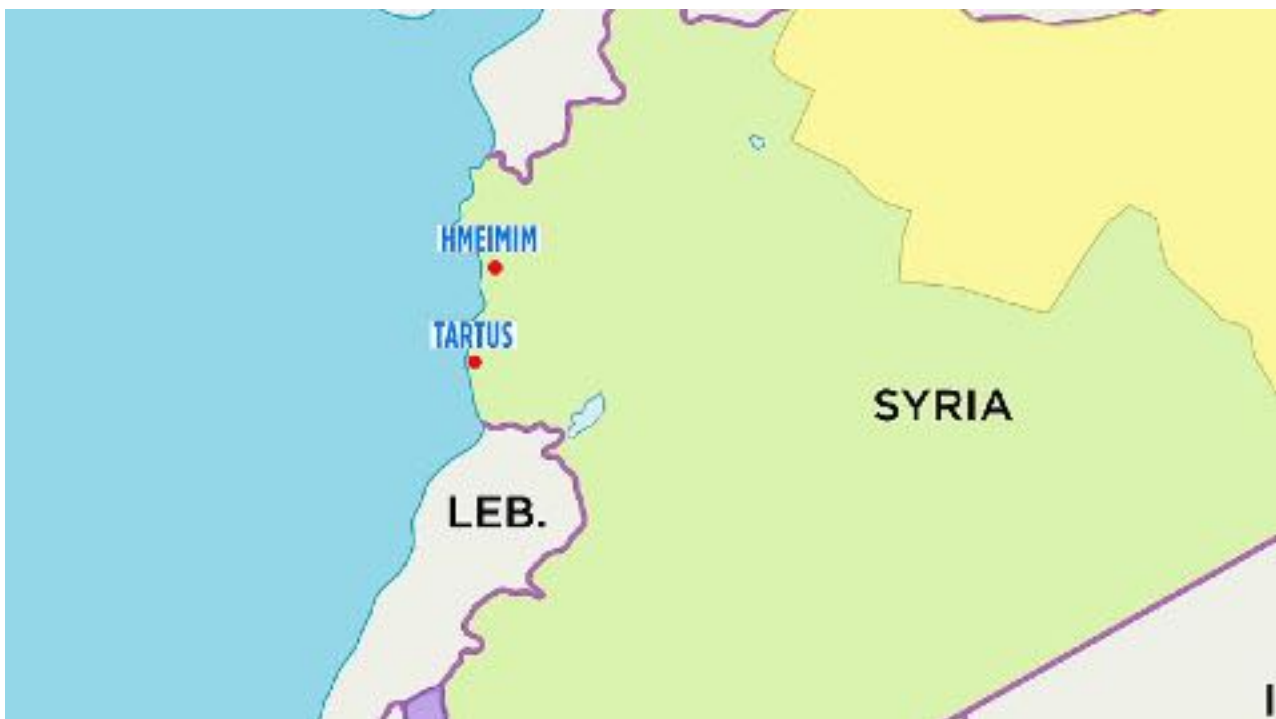
I siti delle basi Hmeimim e Tartus bases, Siria

I media statali russi hanno anche affermato che Mosca ha assicurato il destino delle basi come parte di un accordo che ha visto Bashar al-Assad e la sua famiglia offrire rifugio in Russia.