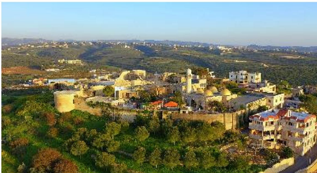
Il Santuario di Shimon a Shamaa, nel Libano meridionale.

su una delle pietre del minareto in stile ottomano del santuario, si legge che la sua costruzione risale al 490 d.H., cioè prima dell'arrivo dei Franchi, che costruirono il castello che domina il Mar di Tiro e la Palestina settentrionale.