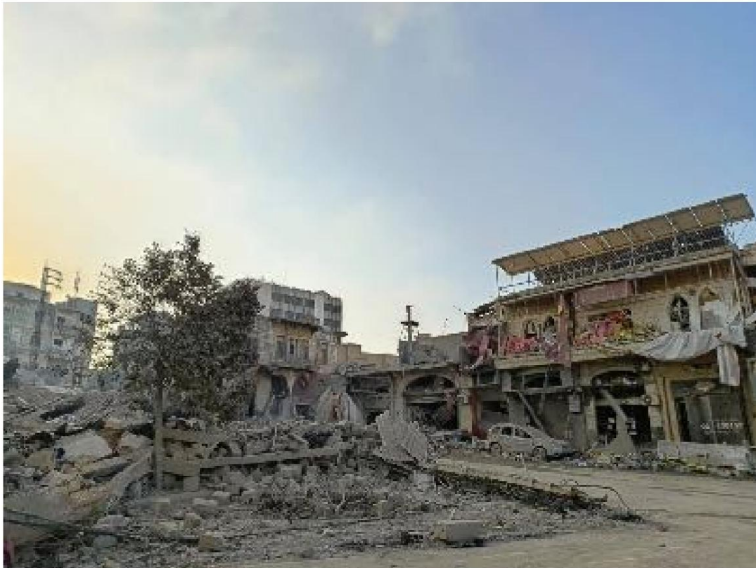
Il secolare suq di Nabatieh, devastato e ridotto in rovina dopo un bombardamento israeliano.