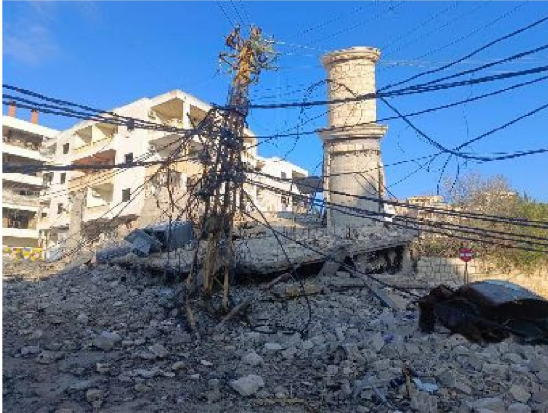
Distruzione completa di una moschea a Nabatieh, ridotta in macerie e detriti in seguito a un attacco aereo israeliano.

Il primo e più grande attacco israeliano ha avuto luogo contro il centro commerciale di Nabatieh, che comprende le caratteristiche economiche, sociali e residenziali della città, come l'edificio di fine Ottocento che un tempo era un piccolo albergo chiamato "Lokanda, Fiore del Sud", caratterizzato dai suoi archi in pietra a forma di croce.