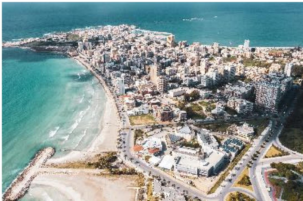
Una veduta di Tiro, in Libano, una delle città più antiche del mondo ad essere abitate ininterrottamente, con la sua architettura storica e il paesaggio costiero.

“Attraverso queste incursioni, l'occupazione voleva eliminare la cultura, il patrimonio e il turismo bombardando il più grande edificio di Tiro, la Torre Awda, e distruggendo negozi, appartamenti residenziali, hotel e ristoranti lungo la linea del mare, che era piena di celebrazioni culturali e artistiche prima della guerra.”