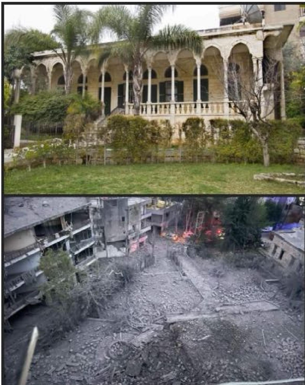
Shaheen House, un'antica casa tradizionale libanese a Nabatieh, nel Libano meridionale, prima e dopo la distruzione causata dagli attacchi aerei israeliani.

Questi pilastri storici, che un tempo ospitavano la gente del posto e custodivano i ricordi delle comunità sociali e politiche di Nabatieh negli anni '60 e '70, ora giacciono in rovina, cancellati insieme alle storie che avevano preservato.