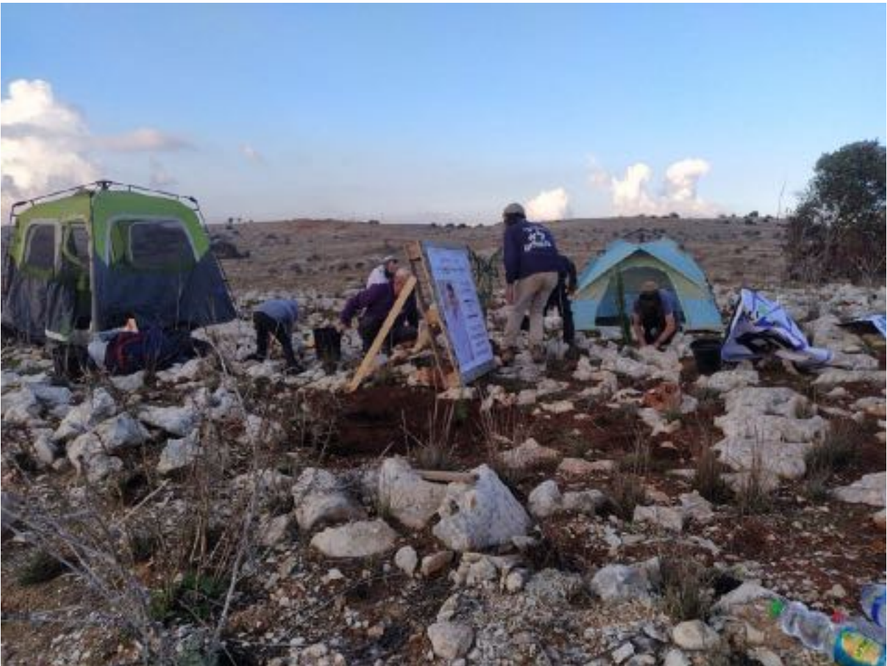
Coloni israeliani del gruppo Uri Tsafon stabiliscono un avamposto nel Libano meridionale, 5 dicembre 2024.

Secondo Azaria, il movimento vanta già migliaia di membri "molto ansiosi e interessati" alle sue attività. L'azione della scorsa settimana non è stata pubblicizzata in anticipo, perché "[l'esercito] ci avrebbe bloccati e non ci avrebbe permesso di entrare". E di certo non hanno incontrato molta resistenza: "Il cancello era aperto e siamo entrati", ha detto.