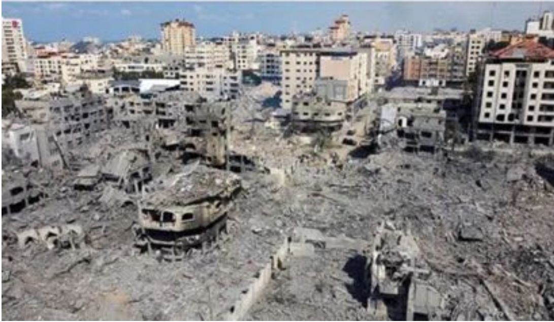
spianando Gaza al suolo