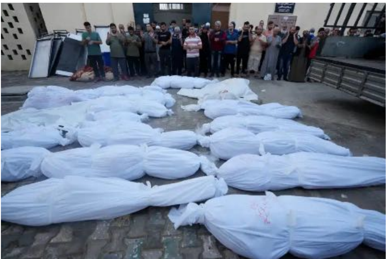
Palestinesi pregano sui corpi delle persone uccise nella Striscia di Gaza davanti all'obitorio di Deir al-Balah.

Un amico ha scritto via email: "Oggi a Gaza non abbiamo cemento per costruire le tombe per coloro che muoiono".