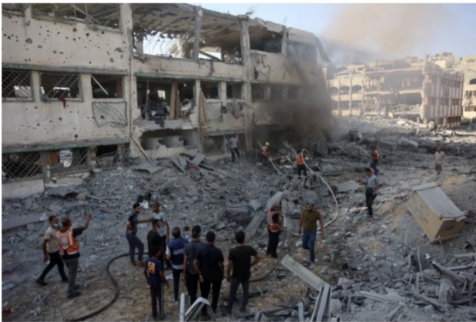
Palestinian rescuers extinguish a fire in a damaged building following Israeli bombardment on the school.