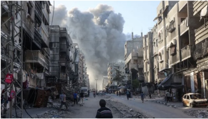
Palestinians rush towards a column of smoke billowing following Israeli bombardment which hit a school complex, including the Hamama and al-Huda schools, in the Sheikh Radwan neighbourhood in the north of Gaza City on August 3, 2024.