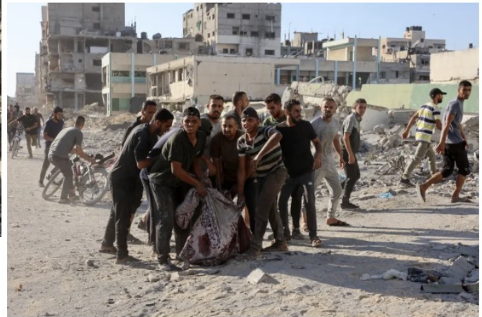
Palestinians evacuate a body pulled from the rubble following Israeli bombardment on the school.