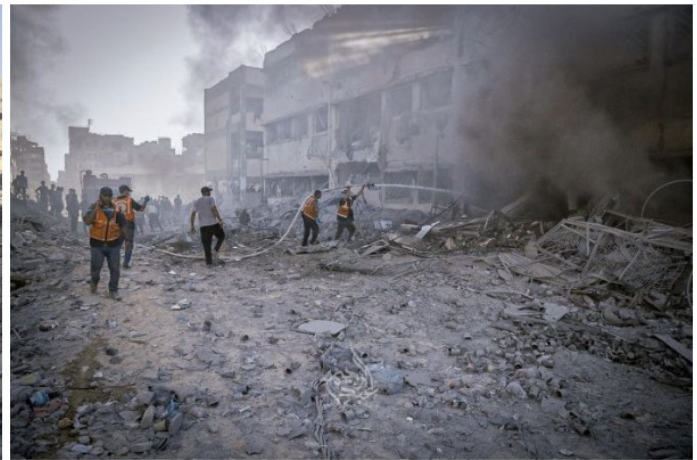
Palestinian rescuers extinguish a fire in a damaged building following Israeli bombardment on the school.

Fonti locali hanno riferito che almeno tre bombe sono state sganciate sulla scuola mentre i soccorritori e i volontari all'interno della struttura cercavano di aiutare le persone a fuggire da sotto le macerie. La struttura è stata completamente distrutta.